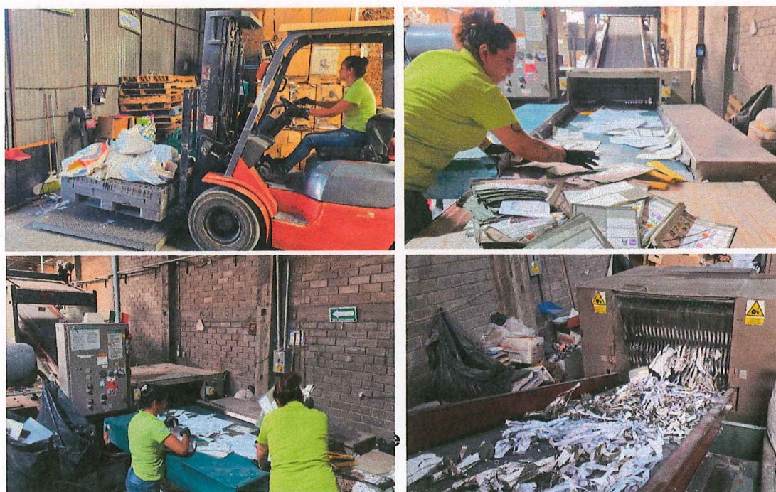
Imagen 4. Destrucción de la Documentación Electoral en la empresa Ecoenlace

El presente informe fue presentado en la Sesión Ordinaria de la Comisión de Organización Electoral del Instituto Electoral de Michoacán de fecha 29 de mayo de 2025.