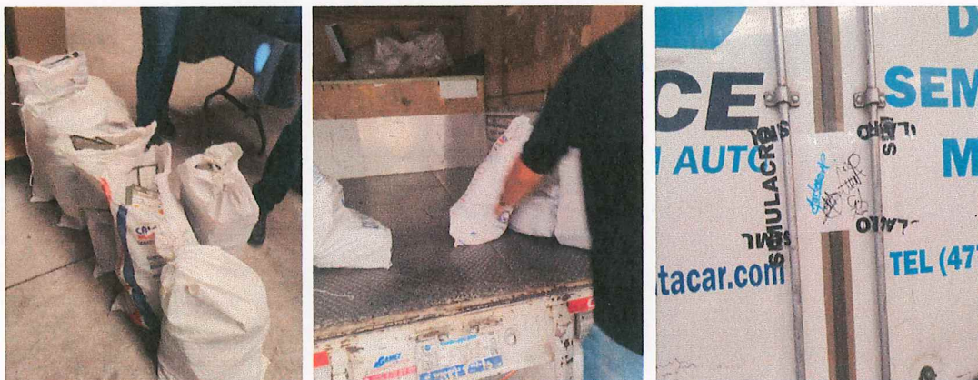
Imagen 2. Carga de la Documentación Electoral

Para ello, el Instituto proporcionó el vehículo donde se cargó la documentación electoral, así como la designación del funcionario público, integrante de este Instituto, encargado de su traslado, como se detalla a continuación: